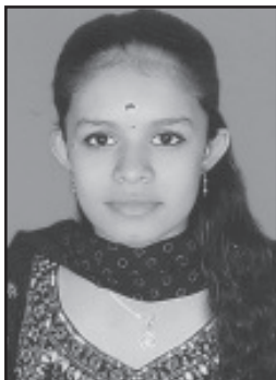
ശിൽപ സുഗതൻ പ്രസംഗം & കവിതാലാപം