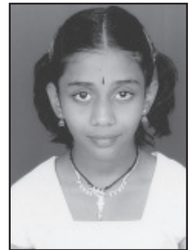
അമൃതാ സജീവ് ഉപന്യാസം